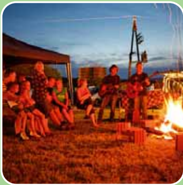
Entspannung beim Lagerfeuer.