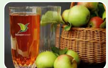
Verschiedene Säfte und Elektrolyte