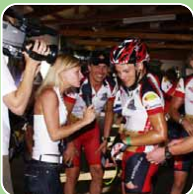
So sehen Sieger aus...