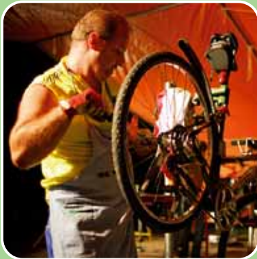
Gratis-Radservice rund um die Uhr