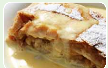
Strudeln und Mehlspeisen...