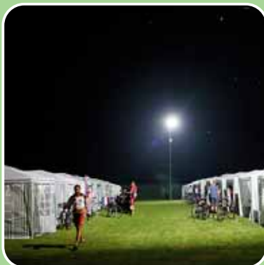
Die Zeltstadt hinter der Halle bietet Ruhe.