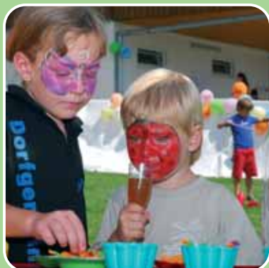
Ein umfangreiches Kinderprogramm wartet auf unsere jungen Gäste!