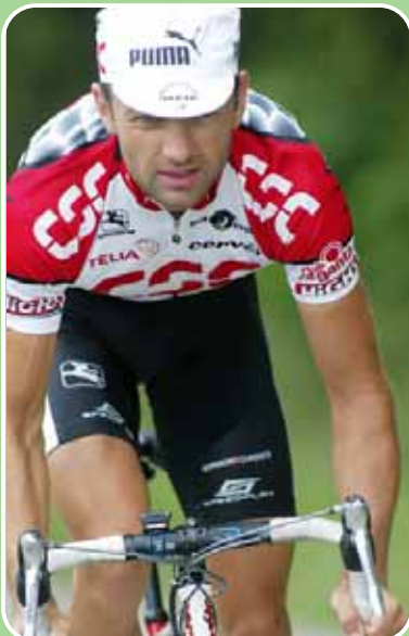
Peter Luttenberger ist einer der zahlreichen prominenten Starter in der Ökoregion Kaindorf.