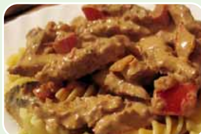
Geschnetzeltes von der Pute