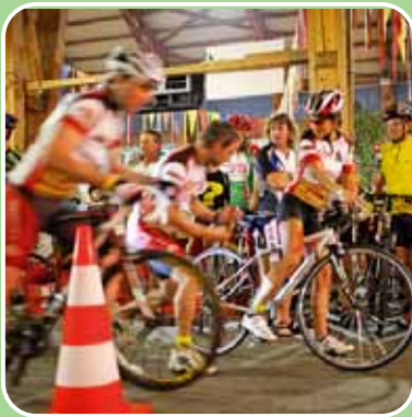
Hektik in der Wechselzone.