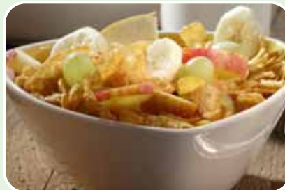
Bio-Müsli mit Bio Joghurt und frische Obst

Alle Teilnehmer haben die Möglichkeit bei der Anmeldung gegen einen Aufpreis von 25,- bzw. 20,- Euro eine Vollverpflegung für die gesamte Renndauer (24 bzw. 12 Stunden) zu buchen. Die Verpflegung mit warmen und kalten Gerichten (siehe Speiseplan) bzw. Müslis, Obst und verschiedensten Natursäften steht im Speisezelt ständig zur Verfügung. Für alle anderen Fahrer und die Besucher stehen ausreichend Verpflegungsstände bereit. Das Fahrerlager und die Sanitärräume befinden sich unmittelbar hinter dem Start/Ziel Gelände. Beim angrenzenden Fußballtrainingsplatz wird eine Zeltstadt aufgebaut (begrenzte Plätze). Es ist auch möglich ein eigenes Zelt mitzubringen (siehe Anmeldeformular auf www.oekoregion-kaindorf.at ). Für die entsprechende Schlafausrüstung hat jeder Teilnehmer selbst zu sorgen. (Siehe Anmeldeformular unter www.oekoregion-kaindorf.at )