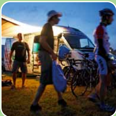
Campingatmosphäre hinter dem Start-Ziel-Gelände