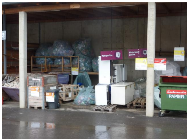
Sortenreine Trennung im ASZ

Gemeinden und Bürger haben hier die Möglichkeit durch richtige Abfalltrennung Kosten zu sparen und für sortenrein getrennte Abfälle (Eisenschrott) Erlöse zu erzielen. Mit diesen Einnahmen kann Ihre Gemeinde die Müllgebühren niedrig halten oder ein Ansteigen verhindern. Geben sie Ihre wertvollen Abfälle wie Eisenteile, Alufelgen, Kabelreste oder ausgediente Elektroaltgeräte nicht den ungarischen Sammelbrigaden, sondern bringen Sie diese Abfälle ins ASZ. Wertvolle Rohstoffe und gute Einnahmen gehen bei illegaler Entsorgung verloren.