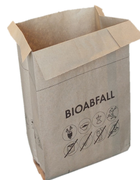
Die praktische Lösung für die Bioabfallsammlung

Nun kann man also den Bioabfall mit dem Sackerl am Weg zum Auto, zur Arbeit oder außer Haus einfach mitnehmen und entsorgen, ohne ein Gefäß zurückstellen zu müssen oder sich schmutzig zu machen.